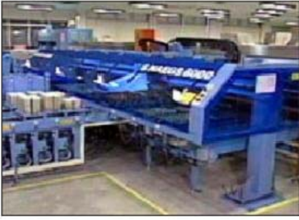
Gambar 2. Packaging Telur

ini telah menggunakan radiasi ultraviolet untuk membunuh bakteri pada kerabang telur dan ternyata dapat menurunkan jumlah bakteri hingga 90% lebih. Desinfeksi pada permukaan telur umumnya memerlukan intensitas radiasi sinar ultraviolet yang tinggi. Ultraviolet tidak dapat menembus kerabang telur namun hanya membunuh mikroorganisme di permukaan kerabang.