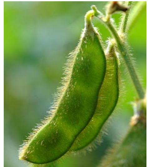
Gambar 1. Kedelai Mallika pada tempat polong berbulu coklat

unggul kedelai hitam itu adalah Khibar, yakni kedelai hitam berukuran biji besar, Khipro berprotein tinggi dan Khilan bercotyledon hijau. Keunggulan ketiganya adalah dapat menghasilkan produksi kedelai lebih banyak sekitar 18% dibanding dengan kedelai lain seperti Cikuray, Burangrang dan Wilis bahkan lebih unggul dari kedelai Mallika (Mallika 2,34 ton/Ha, 3 varietas unggul itu 2,51 ton/Ha). Keunggulan lain ketiga kedelai itu merupakan jenis kedelai besar 14 gram/100 biji, proteinnya tinggi 45,58% (kedelai impor dan kedelai lokal, protein 37,6%)