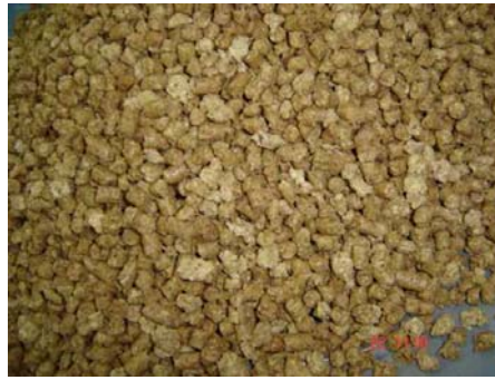
Gambar. 2 Bungkil Kedelai yang harganya makin naik

Di pihak lain, kenaikan biaya produksi bahan pangan asal unggas ini