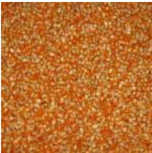
Gambar. 1 Jagung pipilan

Harga pakan ternak mengalami peningkatan yang cukup besar selama satu tahun belakangan ini. Kenaikan harga pakan ini otomatis meningkatkan biaya produksi komoditas pangan asal unggas (daging dan telur). Prosentase kenaikan biaya produksi ini belum terimbangi oleh kenaikan efisiensi performance dari peningkatan genetik. Seefisien apapun performance genetik strain komersial saat ini masih belum mampu mengimbangi peningkatan harga bahan baku pakan.