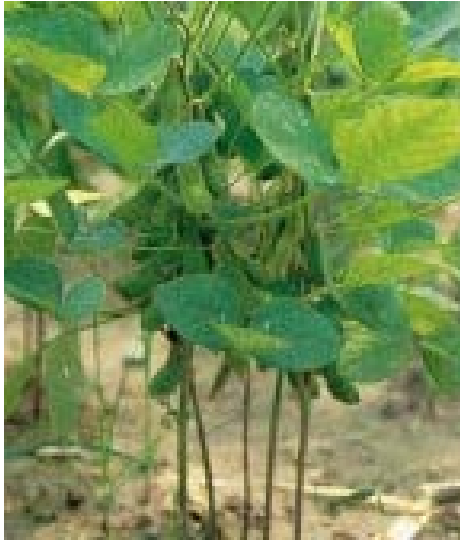
Gambar 2. Batang dari kedelai Mallika berbulu coklat

mengontrol pertumbuhan berat badan hingga 50%. Kadar kolesterol dalam darah juga 25% lebih rendah.