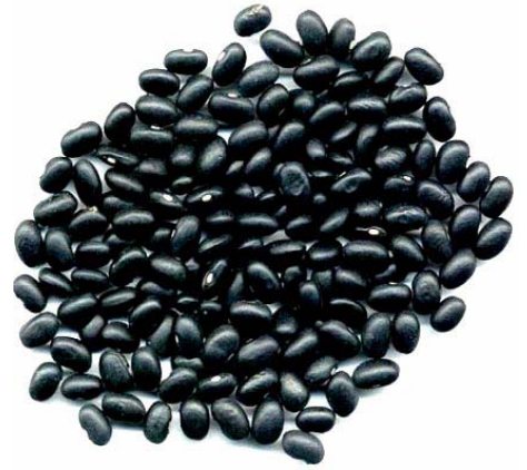
Black Soya Bean Meal

Sejumlah peneliti dari Badan Penelitian Tanam kacang-kacangan dan umbi-umbian (Balitkabi), Malang, Jatim, menemukan 3 varietas unggul kedelai hitam. Ketiganya memiliki kelebihan dibanding dengan kedelai impor atau kedelai lokal. Tiga varietas